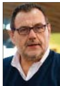
LO CHEF STELLATO GIANFRANCO VISSANI, CHE COLLABORA CON SURGITAL PER LA CREAZIONE DI NUOVE RICETTE PER LA LINEA DIVINE CREAZIONI.