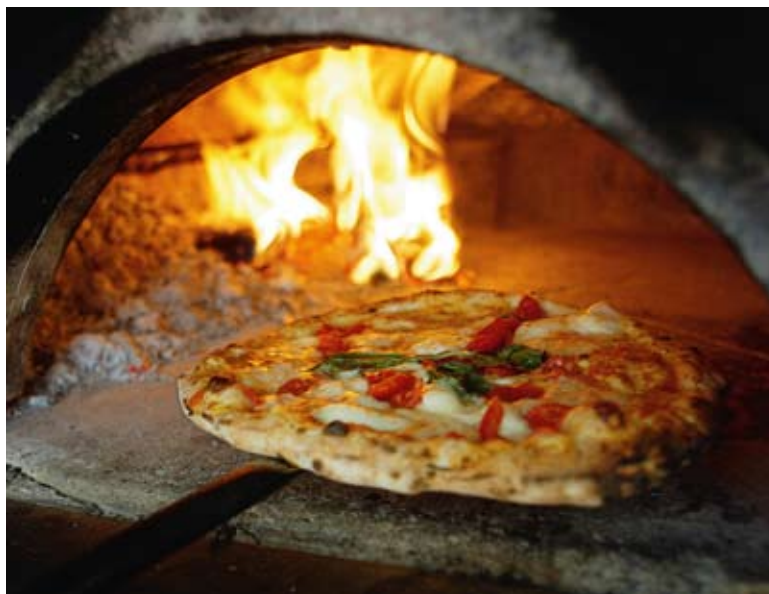
IL FORNO A LEGNA RISULTA DECISIVO PER LA COTTURA E LA QUALITÀ DELLA PIZZA NAPOLETANA. IL DISCIPLINARE DEFINISCE LE CARATTERISTICHE TECNICHE E LE OPERAZIONI DA EFFETTUARE.

presidente dell'Associazione verace pizza napoletana che, insieme all'Associazione dei pizzaioli napoletani e con il supporto della Regione Campania, ha promosso la pratica dell'ottenimento della Stg. «Questo marchio garantisce il processo produttivo. Occorre essere precisi su questo argomento. A nostro avviso, però, anche seguendo la ricetta del disciplinare non si ottiene la vera pizza napoletana, perché la pratica del pizzaiolo è elemento irrinunciabile per ottenere un prodotto secondo tradizione. Per questo, pur essendo